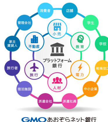
GMO あおぞらネット銀行

事業者さまのビジネス領域に、当社の銀行機能をパーツとして埋め込み、ご活用いただくサービスです。業界・業態を問わずさまざまなシーンで、金融サービスを事業者さまのサービスとしてお使いいただくことが可能です。