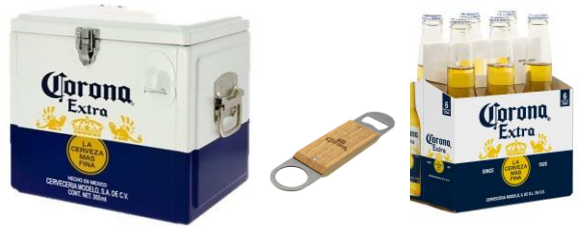
左より【B賞】ビール特製アウトドアグッズ、【B賞/C賞】コロナビール