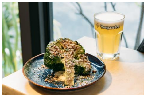
プロックリーステーキ