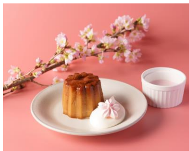
桜プリン ヒューガルデン ロゼ」ボトルビール付き