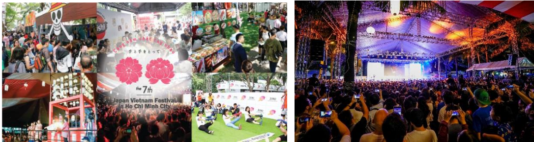
※第6回JVF / 2019年1月19日(土)～20日(日) 開催時の様子