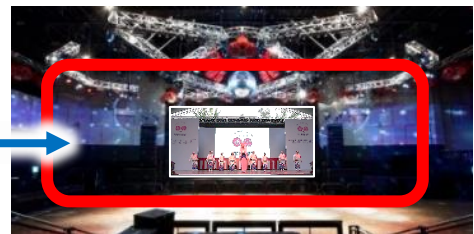
ステージイメージ 日本・中継会場 SHIBUYA STREAM Hall

日本側イベントブース出展100ブースとリモートステージ出演（ライブ中継）の団体を、11月30日まで募集中です。