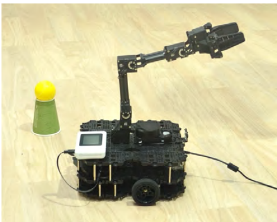
ロボットの遠隔制御デモ

ご来場された方には、ローカル 5G 環境下でロボットの遠隔制御を実体験いただくことが可能です。