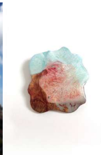
© Leon art jewelry created by 海と梨