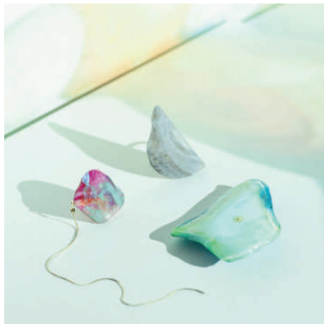
Leon art jewelry created by 海と梨

着る人に創造性を与えることを目的とし、「Empowering Creatives」を理念とする気鋭のユニセックスブランド。テラリングとワークウェアの要素をミニマルな世界観によって再構築したスタイルを提案します。今回は、既存の世界観を保ち、新たな要素を取り入れた 22SS コレクションを発表します。