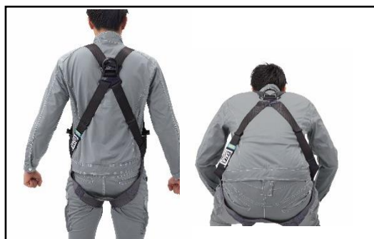
「X型背面ベルト」 前屈時にも背中中のベルトが突っ張らない

3 Mは世界中の現場の声を反映し、安全性と作業性の両方にこだわって製品開発をしています。