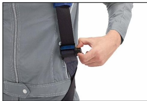
「回転式ベルト調整機能」 レバーを回転するだけでベルトの長さ調整が可能

<3 M™ 墜落防止用製品に関するお問い合わせ先> カスタマーコールセンター TEL: 0570-011-321