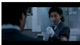
【小栗さん】 「それ、新しい arrows だよ。 洗えるやつ。」