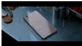
現場に残された arrows Be