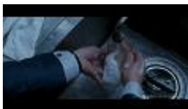
arrows Be を洗う山田刑事