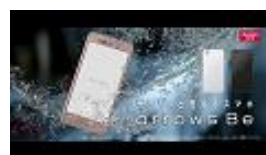
【NA】 「もっと洗えるスマホ arrows」