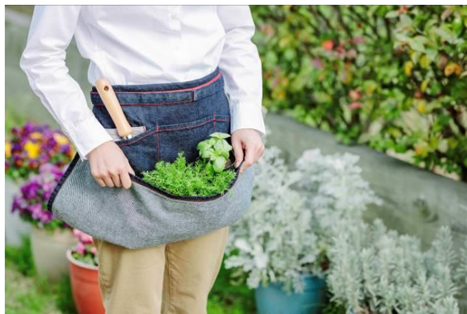
<収納ポケットスタイル>