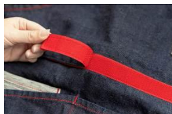
<センターポケット、面ファスナーの腰ひも>