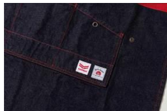
<エコポケット、落下防止用ハトメ>