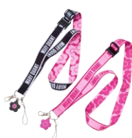
MARY QUANT ネックスト ラップ 全2種 各1,320円