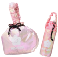
MARY QUANT ランチバッグ 3,190円、 ボトルケース2,640円