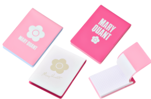
MARY QUANT ロディア カバー付きメモ 全3種 各1,320円