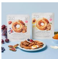
PLAZA・MINiPLA限定 プロテインベーグルチップ 各496円