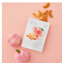
PLAZA・MINiPLA限定 ドライピーチ 598円