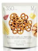
PLAZA・MINiPLA先行発売 バターガーリックプレッツェル 397円