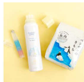
外出先で重宝するスッと心地よい使用感の アイテム。同時に気分もリフレッシュ！