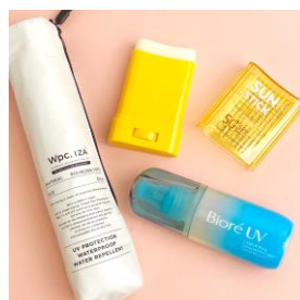
じつは「夏至」は6月下旬ともう目前。 梅雨の晴れ間も、UVケアをお忘れなく！