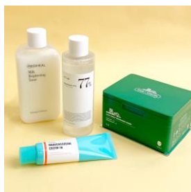
ジメジメシーズンにおすすめ！ さっぱり使用感のスキンケアアイテム。