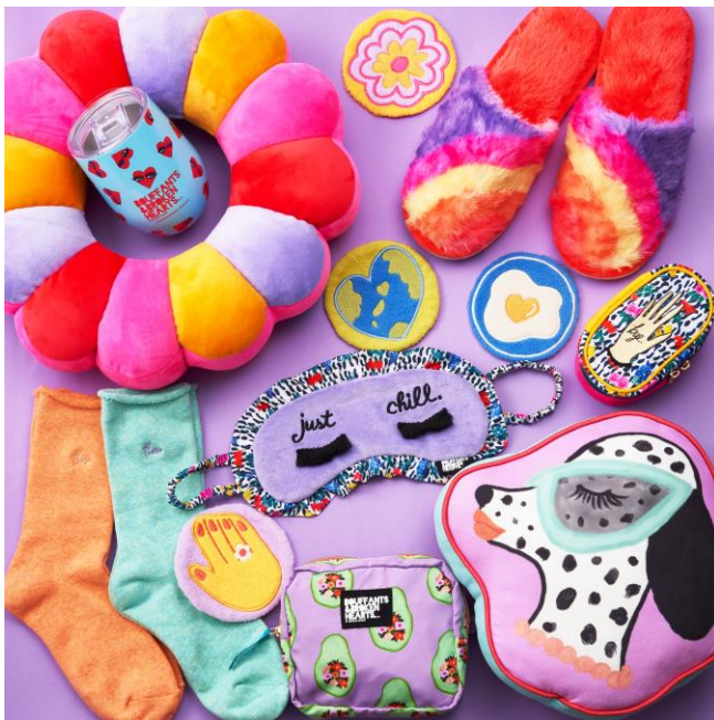
商品ラインアップ(イメージ)

株式会社スタイリングライフ・ホールディングス プラザスタイル カンパニー(東京都新宿区)は、2022年10月7日(金)から27日(木)まで、全国のPLAZA・MINiPLAにて、ルームアイテムを集めたプロモーション「Queen Mode in my room.(クイーンモード イン マイ ルーム)」を開催します。商品ラインアップのひとつとして、ライフスタイルブランド「BOUFFANTS & BROKEN HEARTS(ポウファンツ・アンド・ブロークンハーツ)」とコラボレーションしたPLAZA・MINiPLA限定アイテムを発売します。