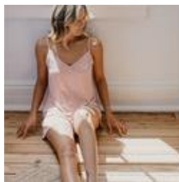
グッドナイトスリーブ キャミ 3,300円、グッドナイトスリーブショーツ 3,520円