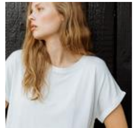
ダウンタイムラウンジトップ 4,950円

2011年、Boody(ブーディ)はオーストラリア・シドニー東部の美しい海沿いの地に誕生しました。見た目も着心地も良いものをお客さまに提供したい…そんな想いが込められたブーディのアイテムは、今や世界中で販売されています。ブランド名は、BAMBOO(竹)とBODY(カラダ)を掛け合わせたもの。