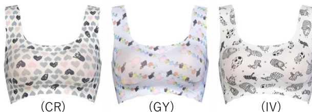
全3種 各3,700円 (M・L・LL / LLサイズは4,000円)

ラクなつけごち、ナチュラルで美しいバストシルエットを実現。タテ・ヨコに伸びるフリーなカッティング素材により、カラダになじむ気持ちさを実感していただけます。