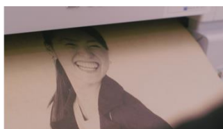
店内に設置したプリンターでラッピングペーパーを出力