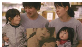
世界にひとつだけのオリジナルラッピングが完成!