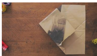
商品をラッピング