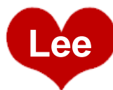
Suzy's Zoo × Lee ランチトート 各¥3,990