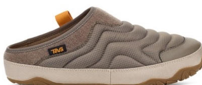
Bungee Code(バンジー コード・新色)