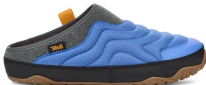
Palace Blue(パレス ブルー・新色)