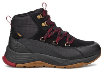
Black/Sun Dried Tomato (ブラック/サンドライトマト)