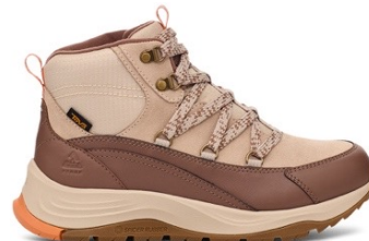
Feather Grey/Acorn (フェザー グレー/アコーン)