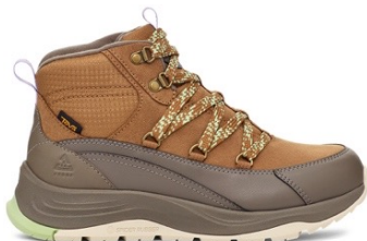
Honey Brown/Bungee Cord (ハニー ブラウン/バンジーコード)