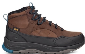
Rain Drop/Black (レインドロップ/ブラック)