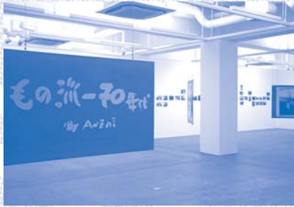
もの派-70年代 by Anzai | 展示写真