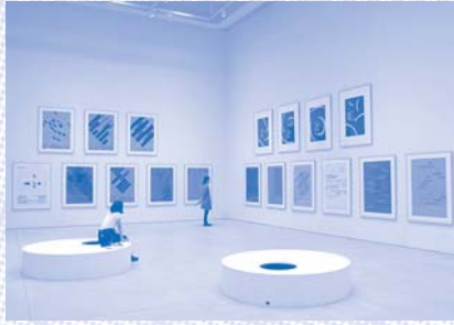
竹尾ポスターコレクション展 ノイエ・グラフィックとその時代 | 展示写真