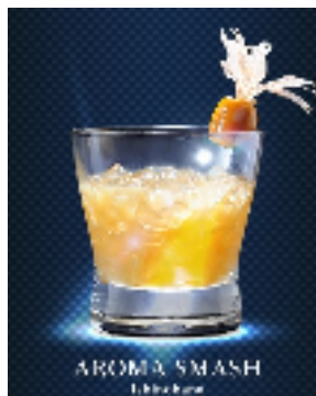
渋谷「石の華」 “AROMA SMASH”