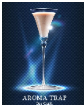
ホテルニューオータニ「Bar Capri」 “AROMA TRAP”