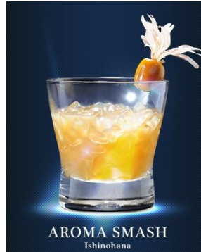
渋谷「石の華」 “AROMA SMASH”