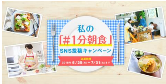
キャンペーンサイトイメージ

簡単だけど手抜きじゃない、いつもの料理にひと工夫して誰でも手軽に作ることができる「1分朝食」を募集する SNS キャンペーンを、6/25～7/31 の期間実施します。自分で作った簡単だけど満足できる朝食の写真を Twitter や Instagram でハッシュタグ「#1分朝食」をつけて投稿すると、抽選で5名様にダスキン「選んで使える おそうじギフトカード 2万円分」がプレゼントされます。