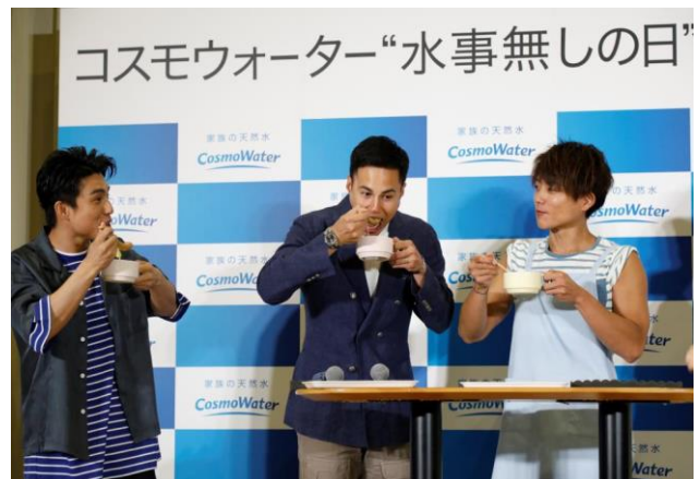
「1分朝食」実践・実食時