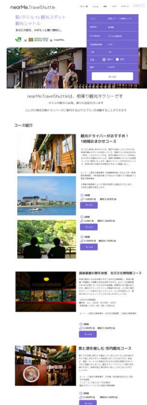
予約WEBサイトイメージ