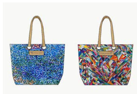
アップサイクル（再利用）商品化イメージ

また、知的障害のあるアーティストの作品を JR 東日本グループ内の工事現場等で使用する横断幕や防音シートにプリントし、使用後にバッグや小物等にアップサイクル（再利用）して商品化する社会貢献型実証実験なども今後計画しています。