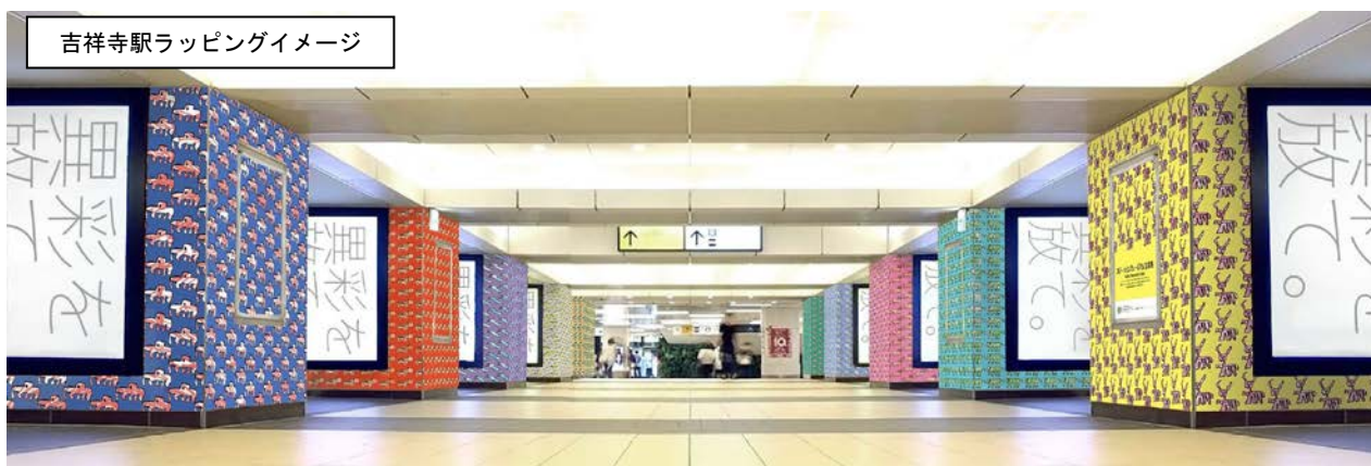
吉祥寺駅ラッピングイメージ

また、知的障害のあるアーティストの作品を JR 東日本グループ内の工事現場等で使用する横断幕や防音シートにプリントし、使用後にバッグや小物等にアップサイクル（再利用）して商品化する社会貢献型実証実験なども今後計画しています。