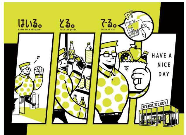
▲店舗利用イメージ

無人 AI 決済店舗の開発は、JR 東日本グループとサインポストで、これまで 2 度にわたり、実証実験を行いました。TTG はこの 1 号店を「ラボ」として位置づけ、運用で得たノウハウを、多くの小売業界が抱える労働力不足や、地域店舗の維持など、様々な課題解決に向けて展開していきます。