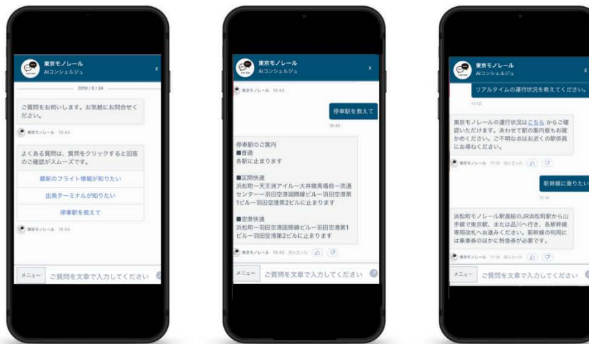
東京モノレール「tripla チャットボット」利用イメージ

※1：旅行特化型チャットボットサービスを展開する tripla 社が JR 東日本スタートアッププログラム 2018 を通じて実証実験を開始