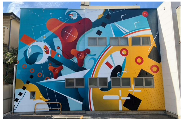
アーティスト：FATE&SUIKO（フェイト&スイコ*合作） 場所：JR 代々木駅（徒歩 12 分） 第 6FMG ビル 東京都渋谷区千駄ヶ谷 3 丁目 3 1-8