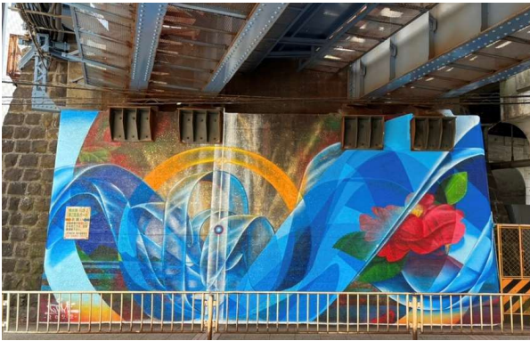
アーティスト：KOMESENNIN9（米仙人/コメセンニン） 場所：JR 横浜駅（徒歩 5 分） 第二高島高架橋 神奈川県横浜市西区高島 2 丁目 5 5-1 3