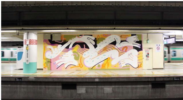
アーティスト：Keeenuue (キーニュー) 場所：JR 大宮駅 埼京線ホーム 21 番線 (東京方)