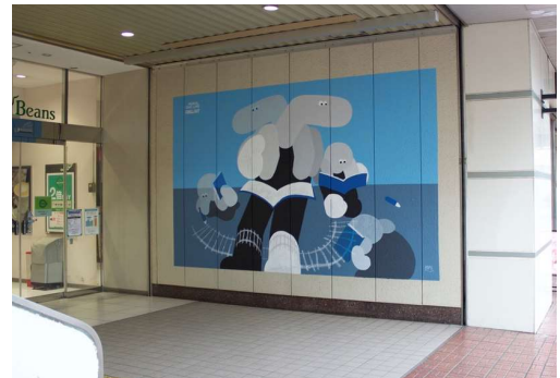
アーティスト：MOTAS (モータス) 場所：JR 武蔵浦和駅 1階東側 (商業施設ビーンズ前)