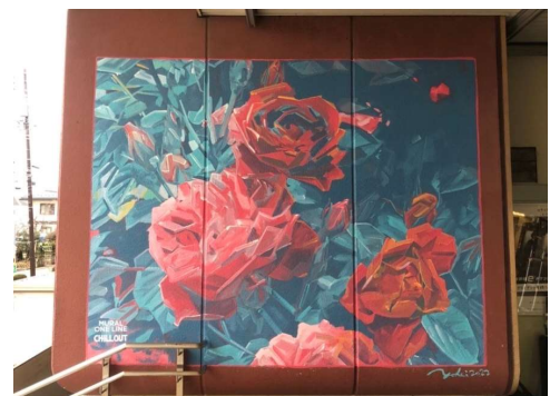
アーティスト：Yohei Takahashi (高橋洋平) 場所：JR 与野本町駅 1階東口