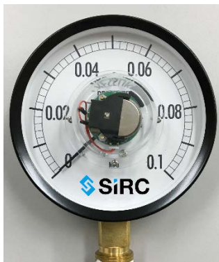
圧力計(中心部に SIRC デバイスを使用)