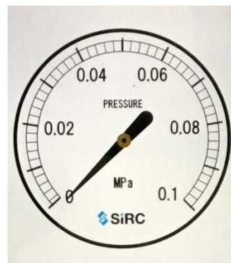
表示画面イメージ