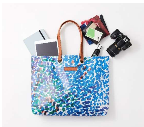
アップサイクルされたアートトートバッグ