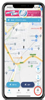
「マイページ」をタップ