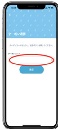
クーポンコード入力