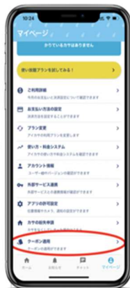
「クーポン適用」をタップ