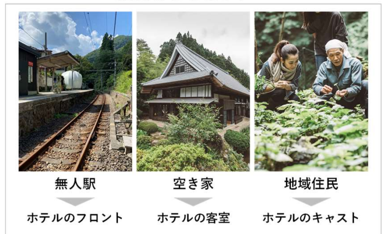
図 沿線まるとホテルの事業イメージ