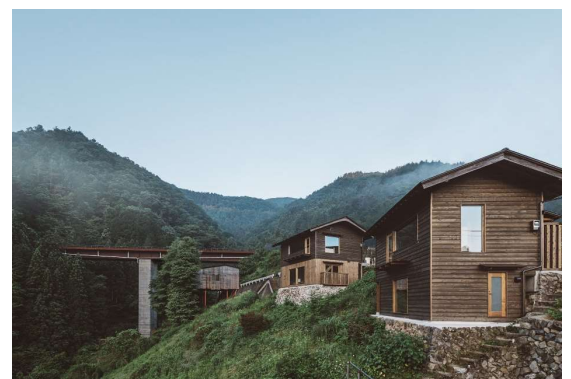
さとゆめプロデュース「NIPPONIA 小菅 源流の村」