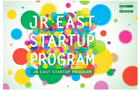
JR東日本スタートアッププログラム