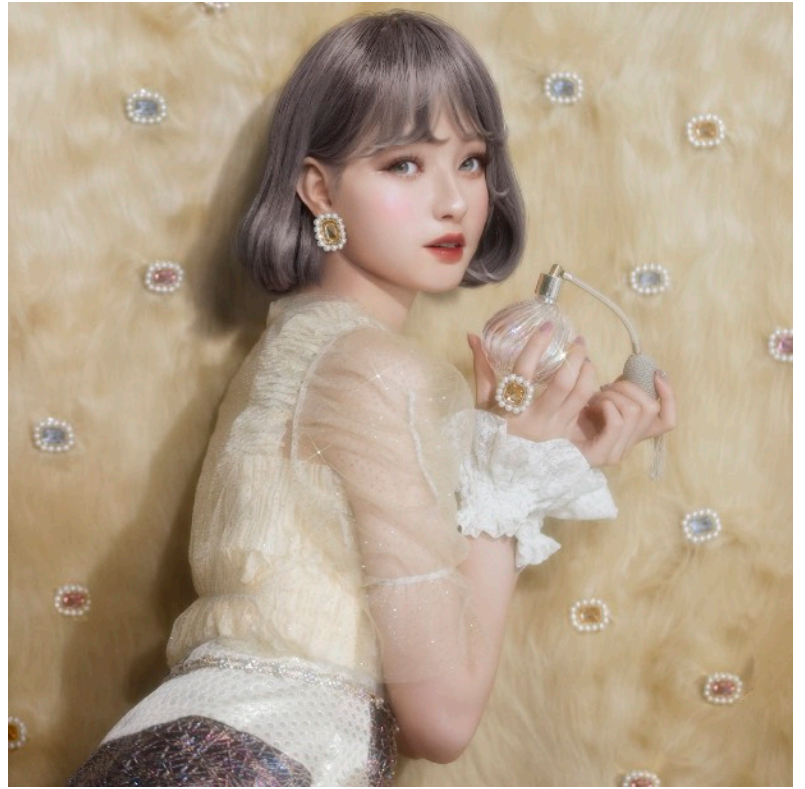
ディフォルメイヤリング/ピアス 3200円（税抜） ディフォルメリング 2300円（税抜） つけると自分が人形になったようなバランス感が楽しい大振りアクセサリ