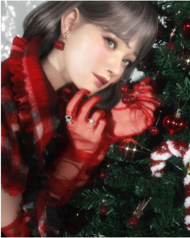
「Liquem」のアイコン商品でもある チェリーイヤリング/ピアス 2300円（税抜）