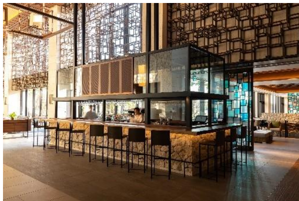
開放的なロビーエリアに位置する「ロビーラウンジ&amp;バー」