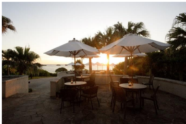
プール横に位置し、海を間近に感じる「プールサイドバー」