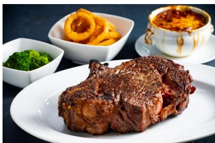
▲オールデイダイニング セラーレ