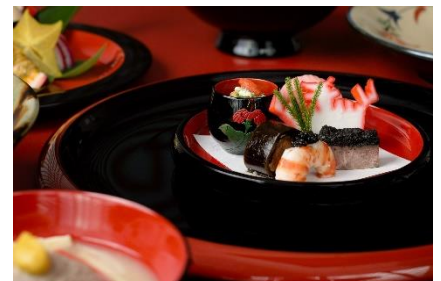
▲シラカチ日本料理