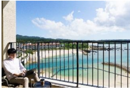
▲客室のオープンエアバルコニー