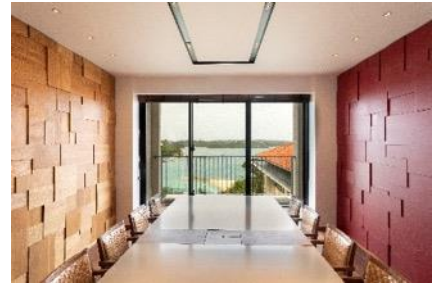
▲ミーティングルーム