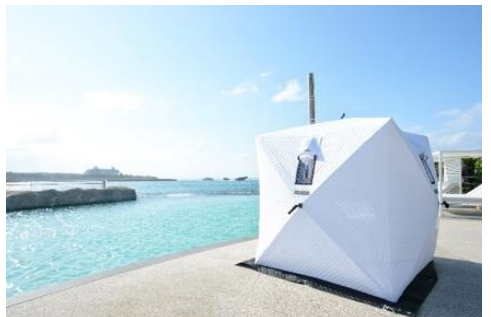
アウトドアサウナ