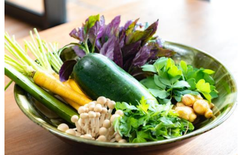
沖縄野菜（イメージ）

朝夕はスープと味噌汁、お昼にパワーサラダをお召し上がりいただきます。自由時間には、漢方カウンセリングと経絡治療（鍼による治療法）をご提供します（合計約2時間）。また、16:30より、海を目の前にしたアウトドアサウナをお楽しみいただけます。