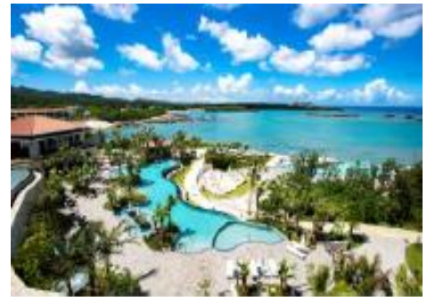
ハイアットリージェンシー 瀬良垣アイランド 沖縄

■問い合わせ：ハイアットリージェンシー 瀬良垣アイランド 沖縄 okaro-marcom@hyatt.com Self Care Pharmacy selfcare.pharmacy@gmail.com