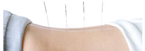
経絡治療のイメージ

その他、腸活プランのお勧めオプションとして、スパ「はなり」ではボディトリートメント「琉球コンプレス」(60分¥19,888)をご用意しております。沖縄産の月桃をたっぷりと使用したハーブボールを人肌に蒸し、お腹を中心として全身に押し当てながら、オイルでマッサージします。血の巡りを促し、心身の温まりを感じていただけます。