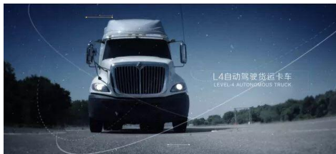
▲無人大型トラック

京東のシリコンバレーチームは、高速道路において無人で運送トラックを走らせる「自動運転トラック」の路上走行テストを2,400時間実施し、成功を収めました。今後この技術に応用し、地域間の交通をカバーする自動運転ネットワークを構築し、2020年に試運転を実施予定です。