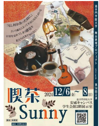
STEP 第14回公演『喫茶 Sunny』

【脚本／演出】 追手門学院大学 社会学部3年 林愛夏 / 心理学部4年 中澤ひかる