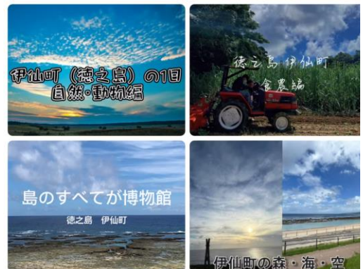
学生が制作した4本の動画