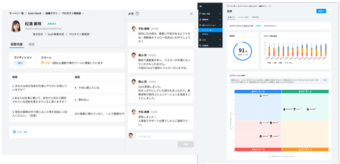
<個人のサーベイ結果>

「個人コンディションサーベイ」機能は、企業が従業員に対して「やりがい」「能力発揮」に関する内容を毎月 1~2 回のペースで聞くことができます。サーベイ結果は、従業員・組織単位で「良好」「倦怠」「移行」「逼迫」などの 4 象限の図で表示されるため、データを分析する専任担当がいなくても従業員のコンディションを一目で理解できます。