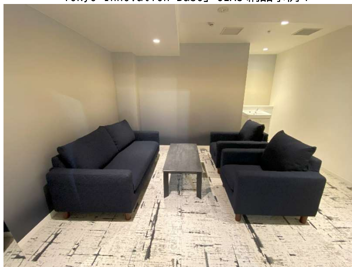
「Tokyo Innovation Base」CLAS 納品事例 2