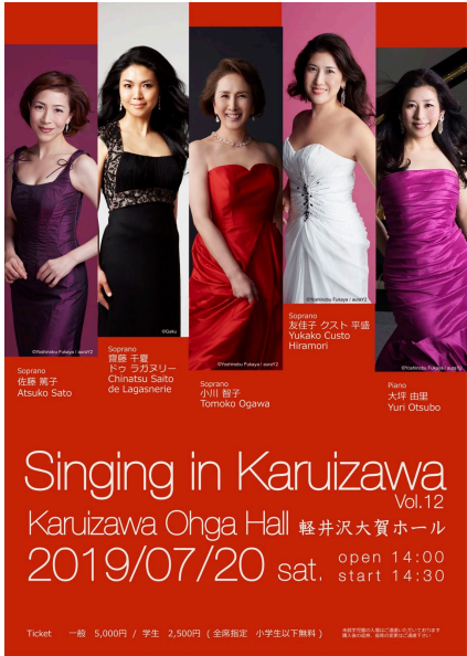
Singing in Karuizawa 2019