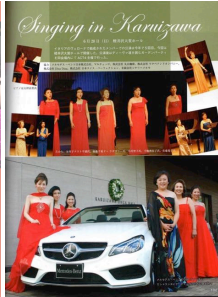
ACT 4 2015 Singing in Karuizawa 2015