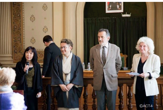
2018年 講演会 パリ1区メリー 結婚の間