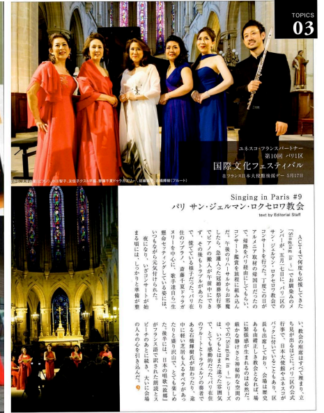
ACT 4 2018 Singing in Paris 2018