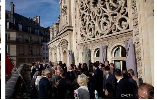
Salle des Mariages - Mairie du 1er