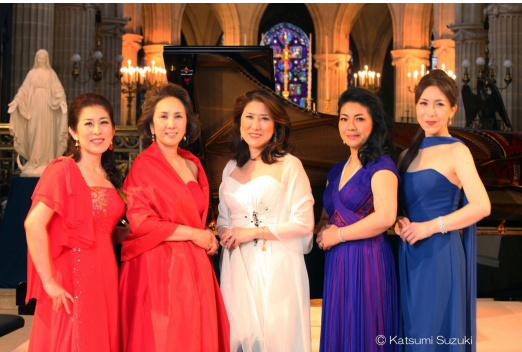
2018年 コンサート Singing in Paris 2018