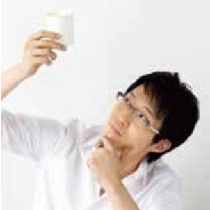
佐藤オオキ | デザインオフィス nendo 代表

街並みに馴染むように、ハコを重ね合わせながら集合させた、「小さな丘」のような建物をデザインしました。ハコとハコの重なりによって、内部は、不意に自然光が入ってきたり、視線が抜けて広がりを感じられ、また外部は、階段でつながったそれぞれのハコの屋上を歩いて、上階へ昇っていくことができます。インテリア、家具にも外部の要素を取り入れることで、屋内外の重なりが生まれることを意識しました。代官山の新たな「丘」の、やわらかな空間をぜひ体験してください。