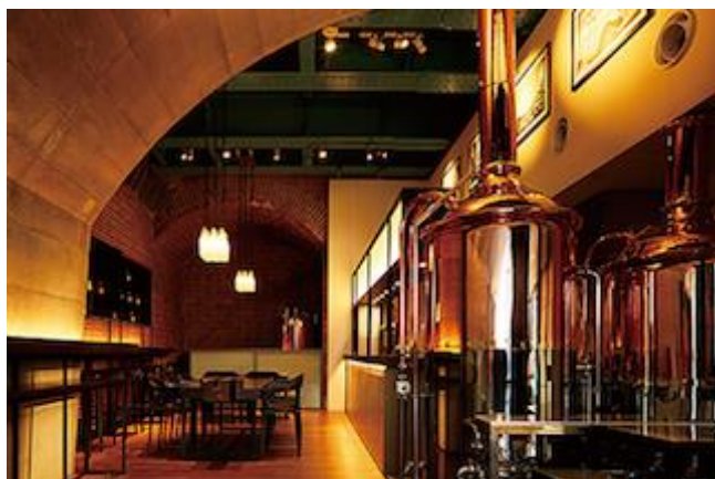
常陸野ブルーイングラボ万世橋