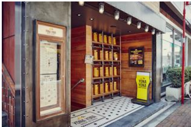
YONA YONA BEER WORKS 吉祥寺店