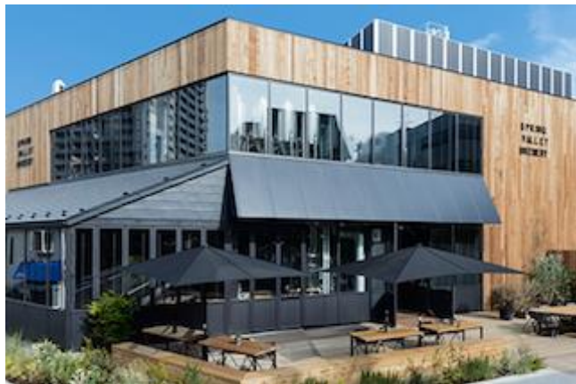
スプリングバレーブルワリー東京