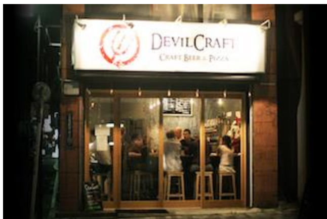
デビルクラフト神田