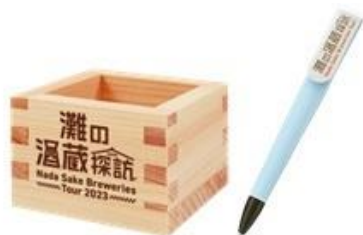
ノベルティグッズ(写真はイメージです。)

2.スタンプを2個以上集めて、指定の場所(神戸市インフォメーションセンター、阪神西宮おでかけ案内所)でご提示いただくと先着2,000名様にノベルティグッズ(ロゴ入り枡もしくはボールペン)をプレゼント。