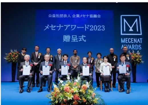
「メセナアワード2023」贈呈式の様子