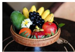
無料フルーツバスケット