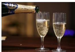
無料シャンパンボトル