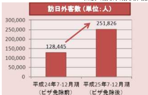
グラフ3. 訪日回数別外客数(実数及び前年同期比)