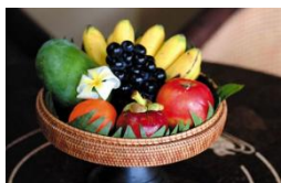
無料フルーツバスケット